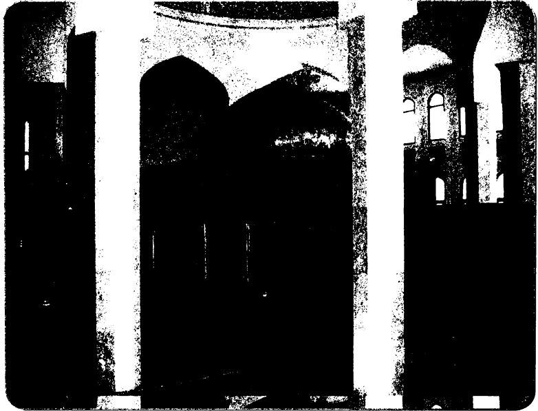
◆ صورة مقبرة ابن ميثم في البحرين